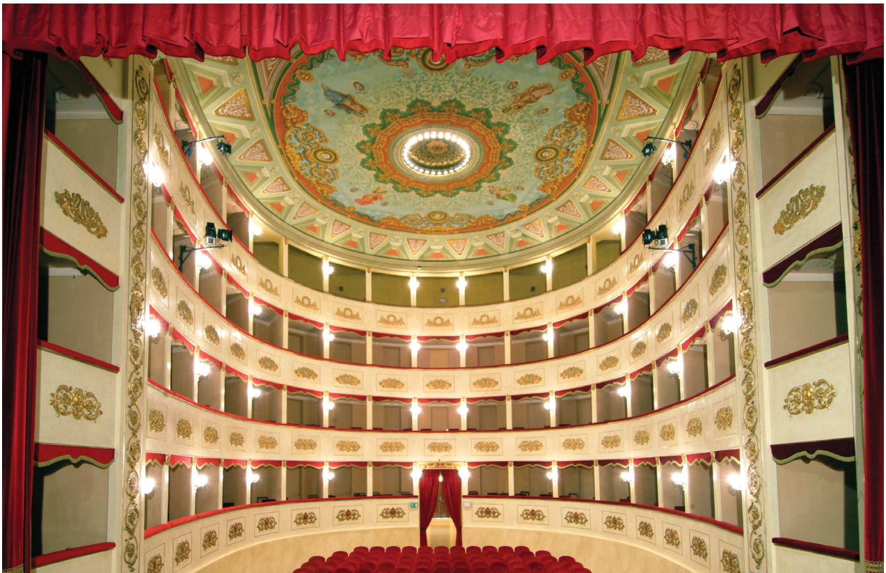
Il teatro dopo l'intervento di restauro.

Si è proceduto anche al consolidamento e fissaggio dell'intonaco al fine di ripristinare la necessaria coesione alla malta e risarcire i distacchi tra l'intonaco stesso e la murature mediante iniezioni di resine acriliche; al consolidamento e fissaggio della pellicola pittorica con resine acriliche; alla pulitura del colore a secco a mezzo bisturi e con gomma pane e wishab