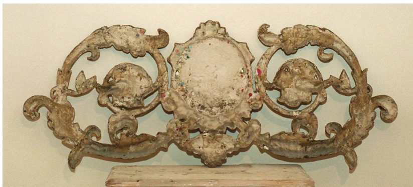
Particolare dello stato di degrado dei fregi.