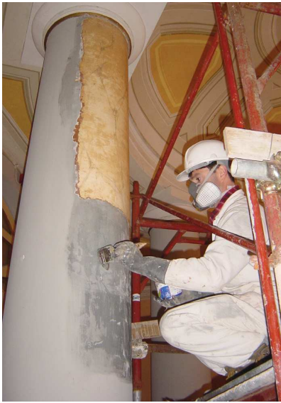
Riscopritura dei finti marmi.