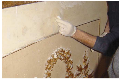
Fasi di restauro dei fregi.