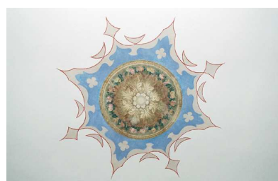
Decorazione del foyer.