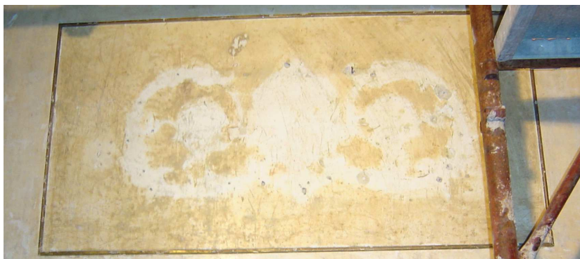
Rimozione dei fregi dai parapetti dei palchi.