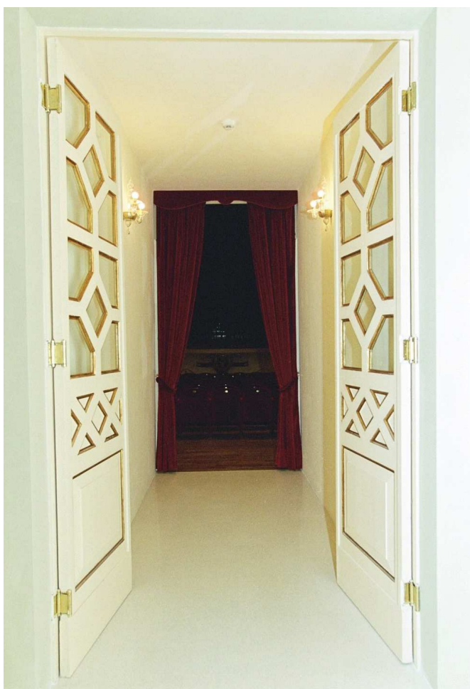
Porta di accesso alla platea dopo il restauro.