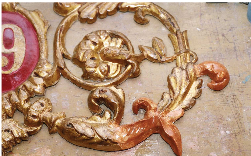
Particolare dei fregi lignei durante i lavori di restauro.