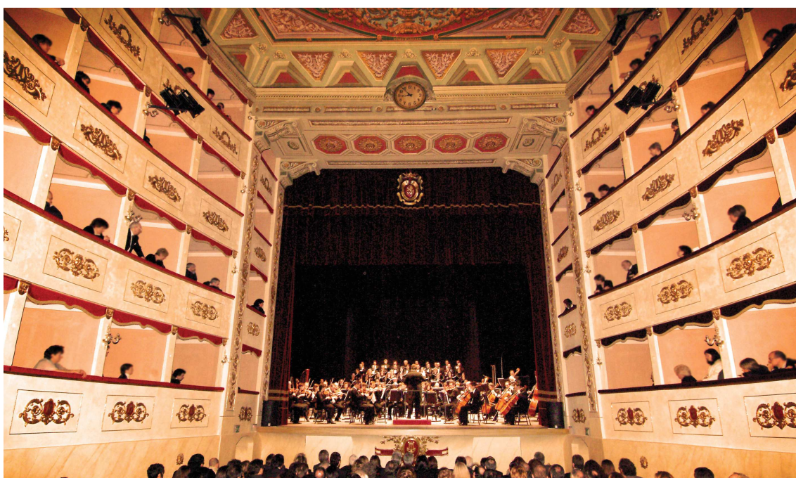
Concerto durante la serata di inaugurazione.