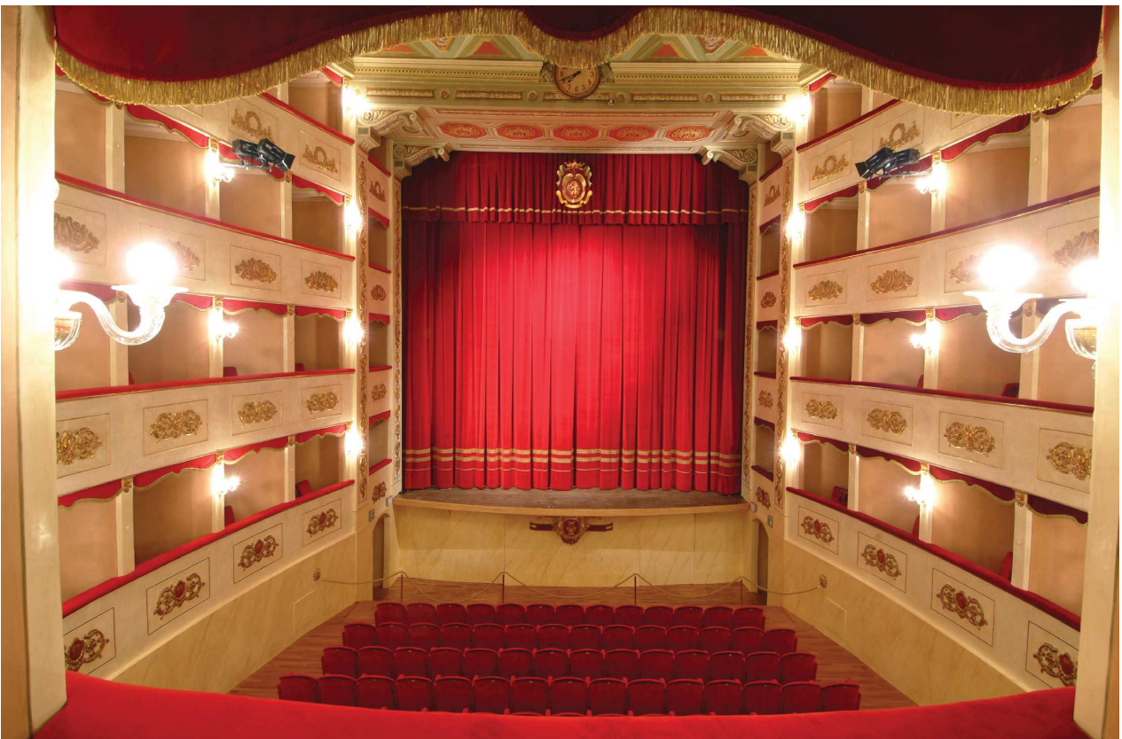
Il teatro come si presenta dopo il restauro.