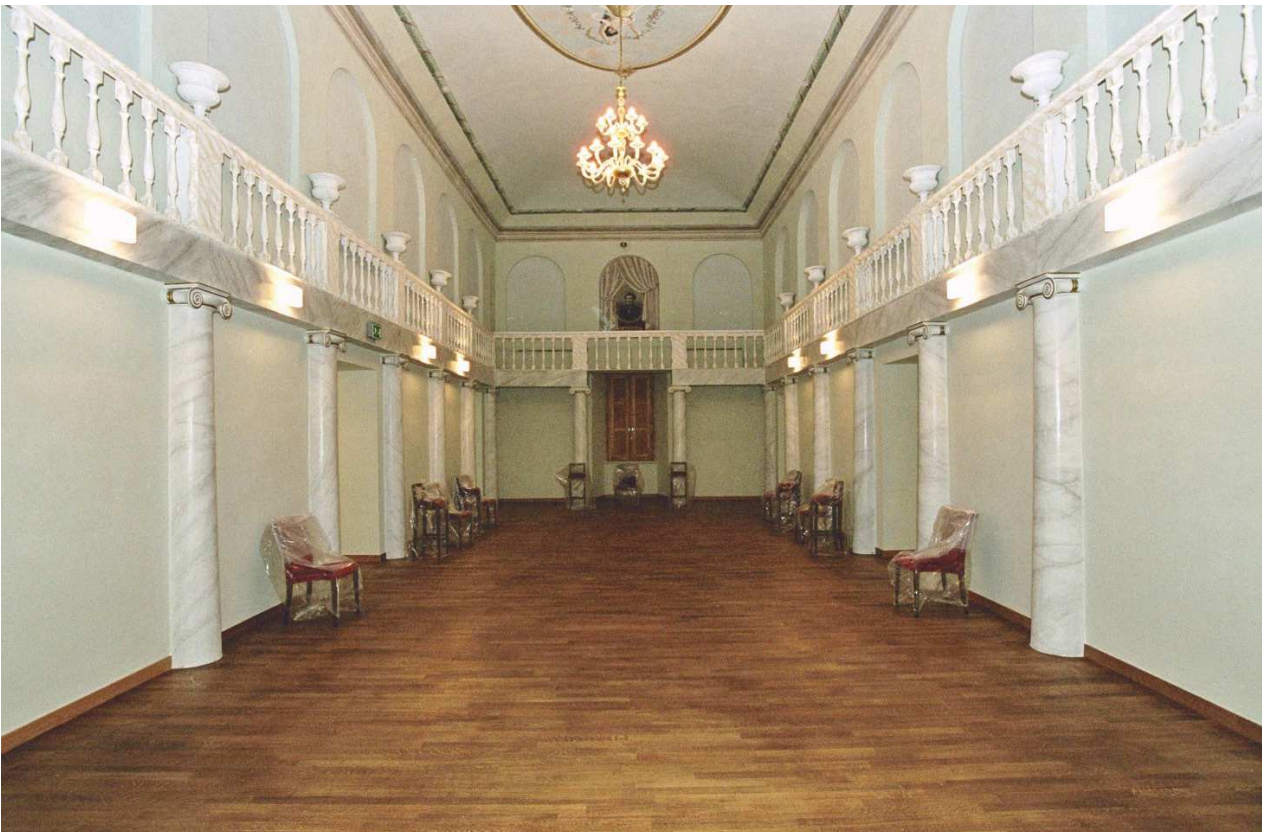
La sala prove dopo il restauro.