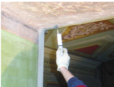
Fasi di consolidamento dei dipinti.