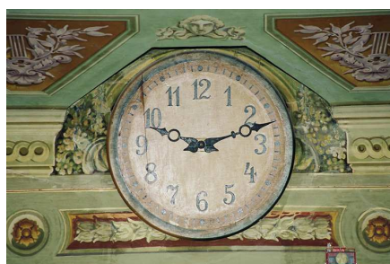
L'orologio sul fronte del boccascena.