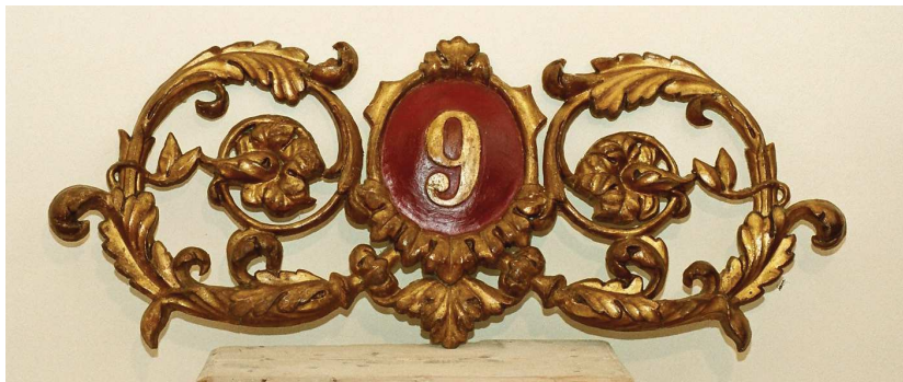
I fregi lignei dopo il restauro.