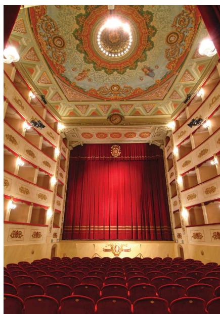
Il teatro dopo il restauro.