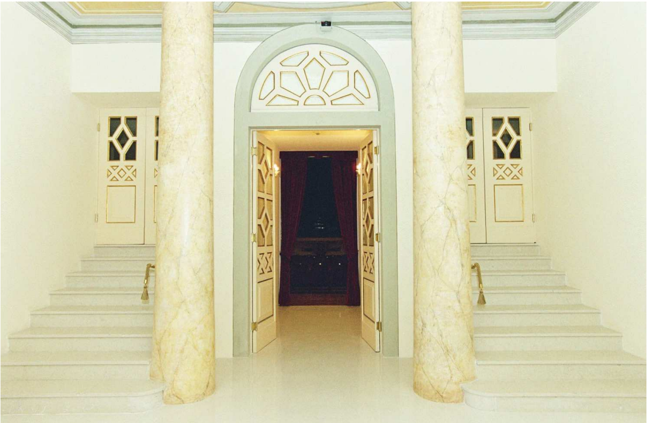
Scale di accesso ai palchi e l'accesso alla platea dopo il restauro.