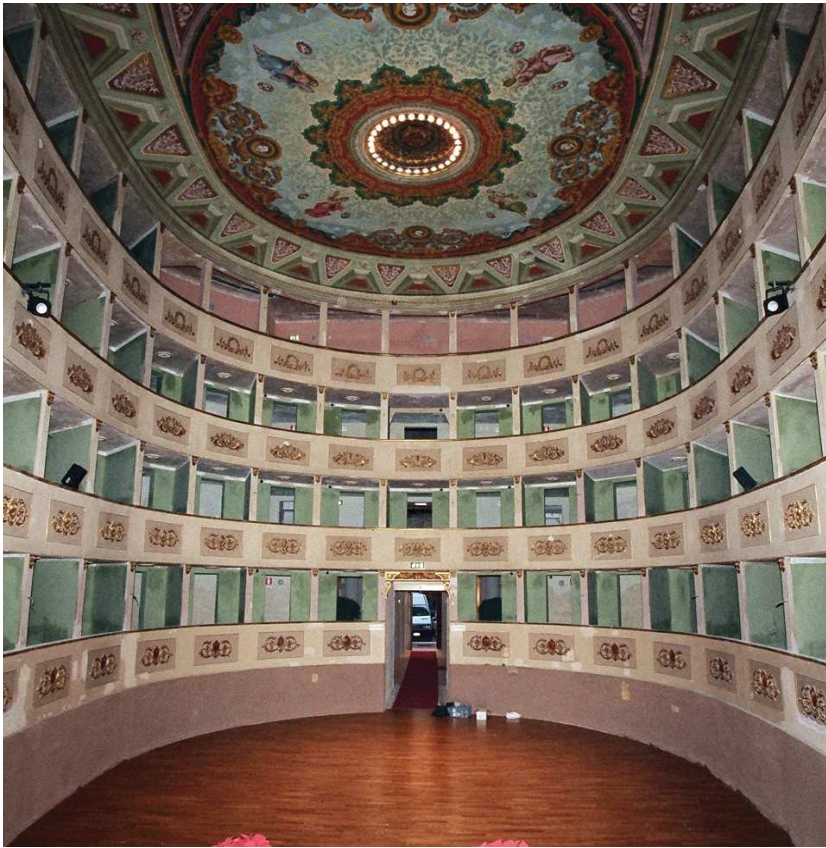
Il teatro prima dell'intervento di restauro.

Le principali opere realizzate sono le seguenti: restauro pittorico della volta della platea, dei parapetti dei palchi, del soffitto e delle pareti del boccascena, delle colonne e del soffitto del foyer, delle colonne e del soffitto della sala dei Trenta; restauro degli stucchi dorati dei parapetti dei palchi, del soffitto del boccascena e delle colonne del boccascena; restauro dello stucco sulla fossa degli orchestrali, rifacimento di finto marmo sullo zoccolo della platea, sulle colonne del foyer e sulle colonne della sala dei Trenta; rifacimento di decorazioni a tempera nei soffitti dei palchi e nei corridoi; restauro ligneo degli infissi del foyer; restauro dell'orologio sito sul frontale del boccascena; restauro oculo ligneo e rosone posto sulla volta della platea.