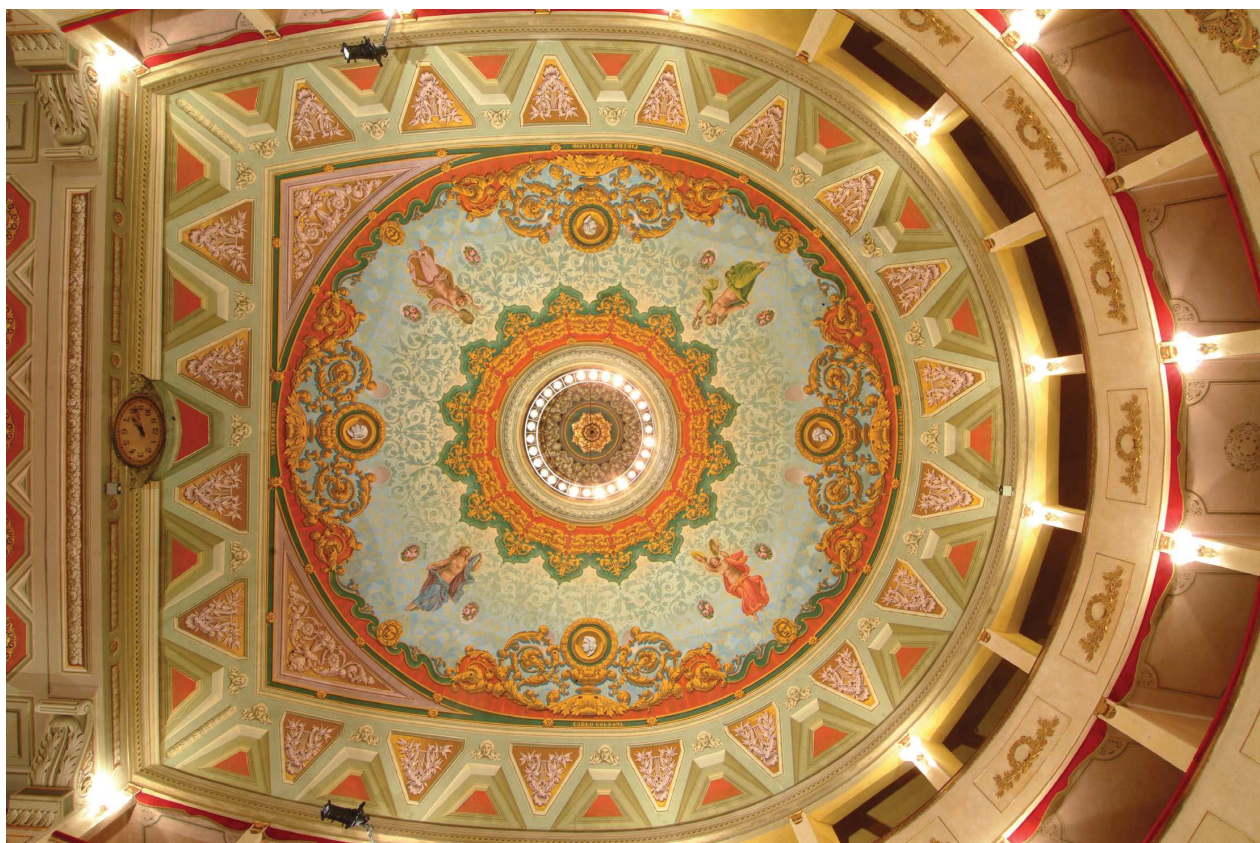
Particolare della volta della platea dopo il restauro.